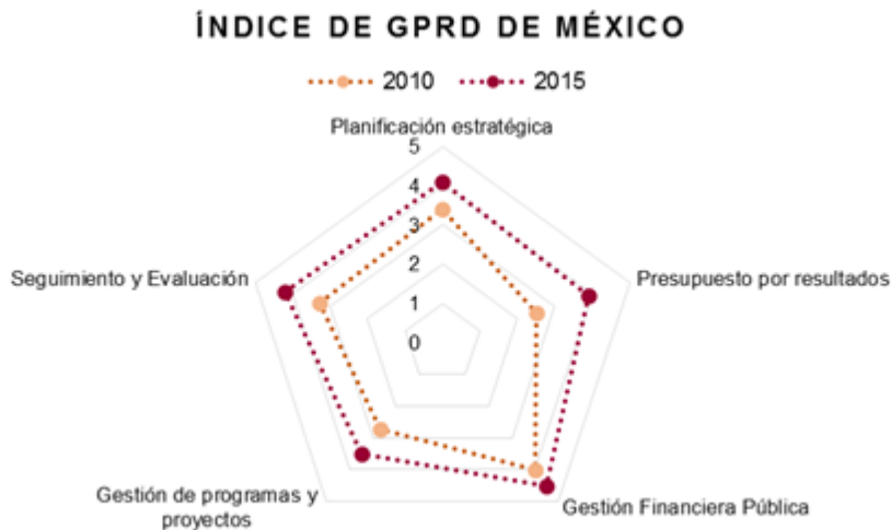
Fuente: Elaborado con base en la información de OCDE (2010) 8 y BID (2015) 9

El cuarto Objetivo prioritario del programa se denominará Promover la profesionalización y la gestión eficiente de los recursos humanos de la Administración Pública Federal se relaciona con el tema Mandar obedeciendo del Eje General 1.- Política y Gobierno del PND, en el cual se refleja con claridad el cambio en el modelo de servicio público que demanda la ciudadanía: los gobernantes deben escuchar a sus gobernados y actuar en consecuencia. Los funcionarios públicos de todos los niveles están obligados a servir, no a servirse; a desempeñarse como representantes de la voluntad popular, no como sus usurpadores; a acordar, no a imponer; a recurrir siempre a la razón, no a la fuerza, y a tener siempre presente el carácter temporal de su función y no aferrarse a puestos y cargos.